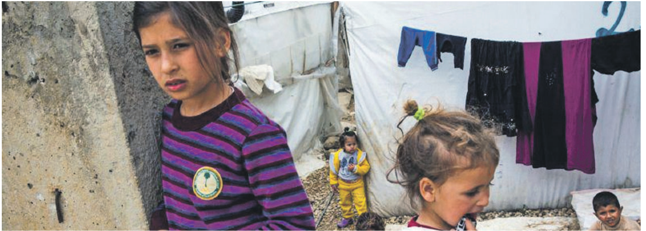
Spendenaufwurf für die syrischen Flüchtlinge. (Foto: ZVG)